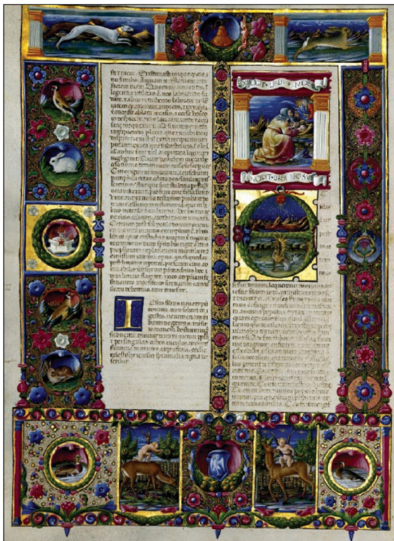
L'incipit del libro della Sapienza @Biblioteca Estense

ARTICOLO NON CEDIBILE AD ALTRI AD USO ESCLUSIVO DEL CLIENTE CHE LO RICEVE - DS2053 - S.30681 - L.1623 - T.1623