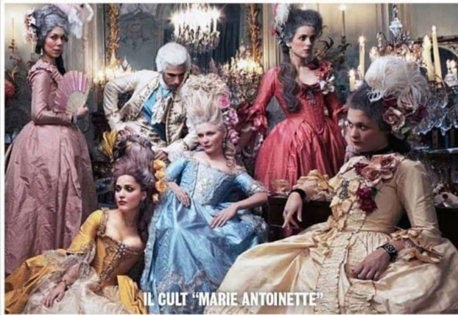
IL CULT "MARIE ANTOINETTE"