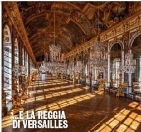
...E LA REGGIA DI VERSAILLES

SANGUE BLU Sopra, il film "Marie Antoinette" (2006) di Sofia Coppola, con Kirsten Dunst, 40 (al centro), ispirato alla regina Maria Antonietta di Francia (1755-1793). A sin., la reggia di Versailles, tanto amata da Maria Antonietta e, più a sin., Schoenbrunn, la residenza austriaca di Maria Teresa. Sotto, a sin., il film "Addio mia regina", ispirato a Maria Antonietta e alla Rivoluzione francese con Léa Seydoux, 37, e Diane Kruger, 46 (a ds.).